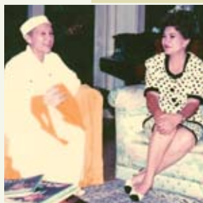
Druhá dáma Celia Diaz-Laurel, Filipíny (1992)