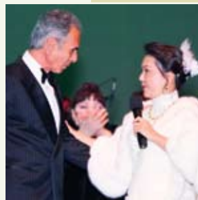
Bill Conti, držitel Oscara a Emmy, americký skladatel, na benefičním koncertu „Jeden svět míru prostřednictvím hudby“ v Los Angeles, Kalifornie, USA (1998)