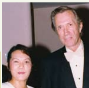
David Carradine, legendární americký herec, „Noc sta hvězd“, oskarový benefiční galavečer v Beverly Hills, Kalifornie, USA (1999)