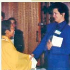
Bývalá první dáma, Margarita Penón Angora, Kostarika (1991)