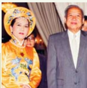
Král Preah Bat Samdech Preah Norodom Sihanouk Varman pozdravil Nejvyšší Mistryni Ching Hai ve svém královském paláci v Kambodži a na znamení přátelství jí daroval vázu (1996).