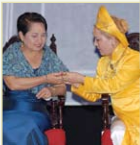
Prezidentka Gloria Macapagal-Arroyo rozmouvala s Nejvyšší Mistryni Ching Hai během slavnostní ceremonie Gusiho ceny míru na Filipínách (2006).