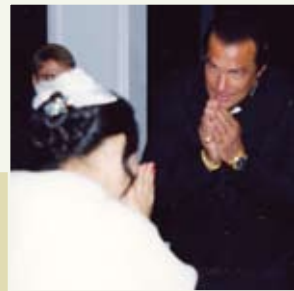
Steven Seagal, slavný americký herec Dětská výzkumná nemocnice sv. Judy, 19. výroční benefiční galavečer v Beverly Hills, Kalifornie, USA (1999)