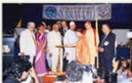
Světový sjezd úcty ke všemu živému, Pune, Indie, 11. listopad 1997