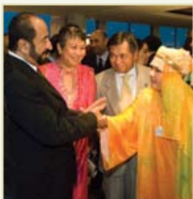
Vládcе Sharjahu, Dr. Sheikh Sultan bin Mohamed Al-Qasimi III., v UNESCO ve Francii (2007).