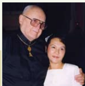
Rod Steiger, americký herec, držitel Oscara, „Noc sta hvězd“, oskarový benefiční galavečer v Beverly Hills, Kalifornie, USA (1999)