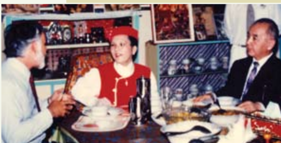
Konzulové USA a Japonska přivítali Nejvyšší Mistryni Ching Hai v Indonésii (1993).