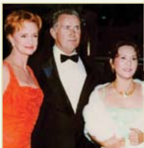
Držitelka Emmy, americká herečka Swoosie Kurtz, a držitel Emmy a Zlatého globusu, americký herec Martin Sheen

15. výroční benefiční galavečer „Kouzelná hvězdná záře“, dětské nadace Hvězdná záře, v Beverly Hills, Kalifornie, USA (1999)