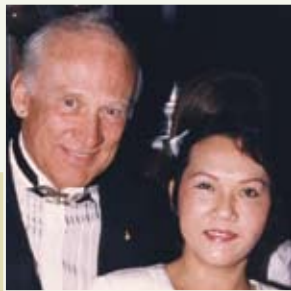
Americký astronaut Buzz Aldrin, druhý muž na Měsíci „Noc sta hvězd“, oskarový benefiční galavečer v Beverly Hills, Kalifornie, USA (1999)