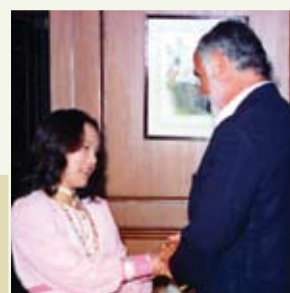
Peter Sparing, hlavní pověřenec pro americké diplomatické služby, Filipíny (1994)