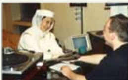
Švýcarské rádio DRS, Švýcarsko, 1993