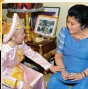
Imelda Romuáldez-Marcos, bývalá první dáma, Filipíny (2006).