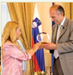
Prezident Dr. Janez Drnovšek obdržel od Nejvyšší Mistryně Ching Hai ocenění „Zářný světový vůdce“, Slovinsko (2007).