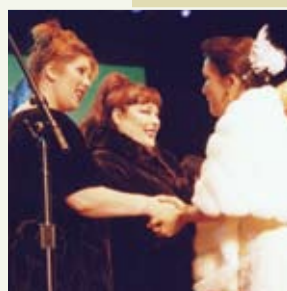
Carnie a Wendy Wilson ze slavných Beach Boys Family & Friends na benefičním koncertu „Jeden svět míru prostřednictvím hudby“ v Los Angeles, Kalifornie, USA (1998)