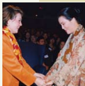
Kieu Chinh, významná aulacká (vietnamská) herečka, „Cesta uměleckými sférami“, dobročinný koncert, Washington DC, USA (1997)