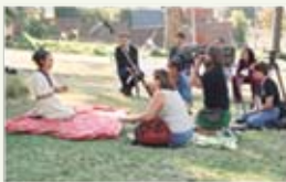
SABC TV, Kapské město, Jižní Afrika, 1. prosinec 1999