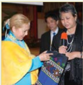
Cecile Guidote-Alvarez filipínská poradkyně prezidenta pro kulturu navštěvuje Nejvyšší Mistryni Ching Hai na Formose (Taiwan) (2007).