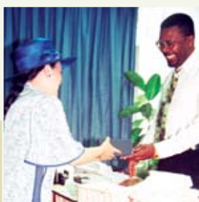
Ministerský předseda Edison James, Dominika (stát v Karibiku) (1996)