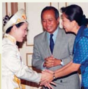
Princ Norodom Ranariddh a princezna Marie Ranariddh, Kambodža (1996)