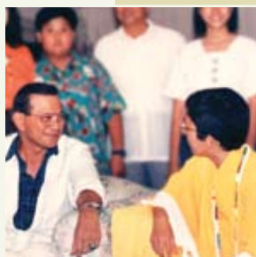
Viceprezident Salvador Laurel, Filipíny (1991)