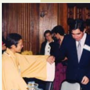
Prezident Óscar Arias Sánchez, Kostarika (1991)