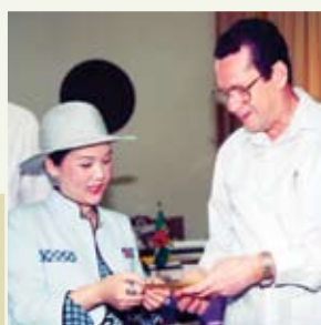
Prezident Crispin Sorhaindo, Dominika (stát v Karibiku) (1996)