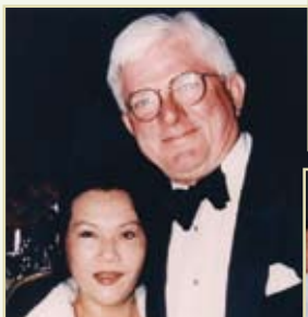
Mnohonásobný držitel Emmy, americká mediální osobnost, Phil Donahue

Dětská výzkumná nemocnice sv. Judy, 19. výroční benefiční galavečer v Beverly Hills, Kalifornie, USA (1999).