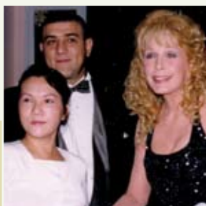
Stella Stevens, americká herečka, držitelka Zlatého glóbu, „Noc sta hvězd“, oskarový benefiční galavečer v Beverly Hills, Kalifornie, USA (1999)