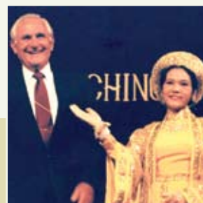
Starosta Frank Fasi prohlásil 25. říjen „Dnem Nejvyšší Mistryně Ching Hai“, Honolulu, Havaj, USA (1993).