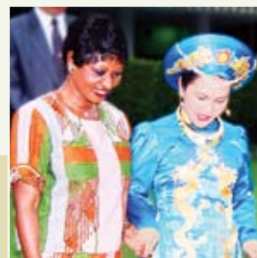
První dáma Henriette Bedié, Pobřeží slonoviny (1996)