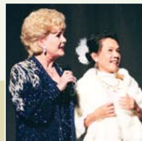
Debbie Reynolds, legendární americká herečka, na benefičním koncertu „Jeden svět míru prostřednictvím hudby“ v Los Angeles, Kalifornie, USA (1998)