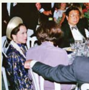
Prezidentský banket, Washington DC, USA (1993)