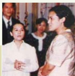
Princezna Maha Chakri Sirindhorn, Thajsko (1994)