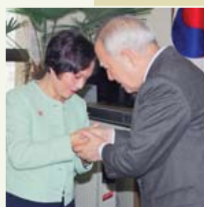
Starosta Cho Soon vyjádřil svou naději, že Nejvyšší Mistryně Ching Hai bude často navštěvovat Koreu a přednášet pro duchovní osvícení korejského lidu, Soul, Korea (1997).