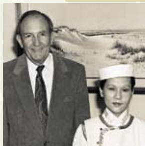
Člen sněmovny reprezentantů USA, Earl Hutto, požval Nejvyšší Mistryni Ching Hai na návštěvu Kongresu ve Washingtonu DC, USA (1993).