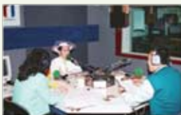
Rádio RFI, Paříž, Francie, 27. leden 1997