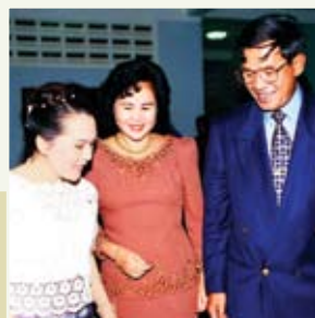
Ministerský předseda Samdech Hun Sen s manželkou Bun Rany, Kambodža (1996)