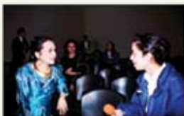
Francouzské rádio Enghien, Paříž, Francie, 27. leden 1997