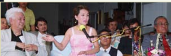
Nejvyšší Mistryně Ching Hai si vychutnala program „Měsíčního festivalu“ společně s legendárními aulackými (vietnamskými) skladateli Thu Ho (vpravo) a Pham Duy (vlevo), který je považován za „Beethovena“ Au Lac (Vietnamu), Kalifornie, USA (1997).

Dětská výzkumná nemocnice sv. Judy, 19. výroční benefiční galavečer v Beverly Hills, Kalifornie, USA (1999).