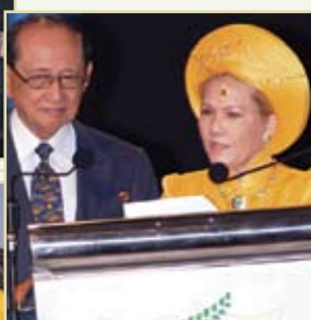
Fidel V. Ramos, bývalý filipínský prezident, Filipíny (2006).